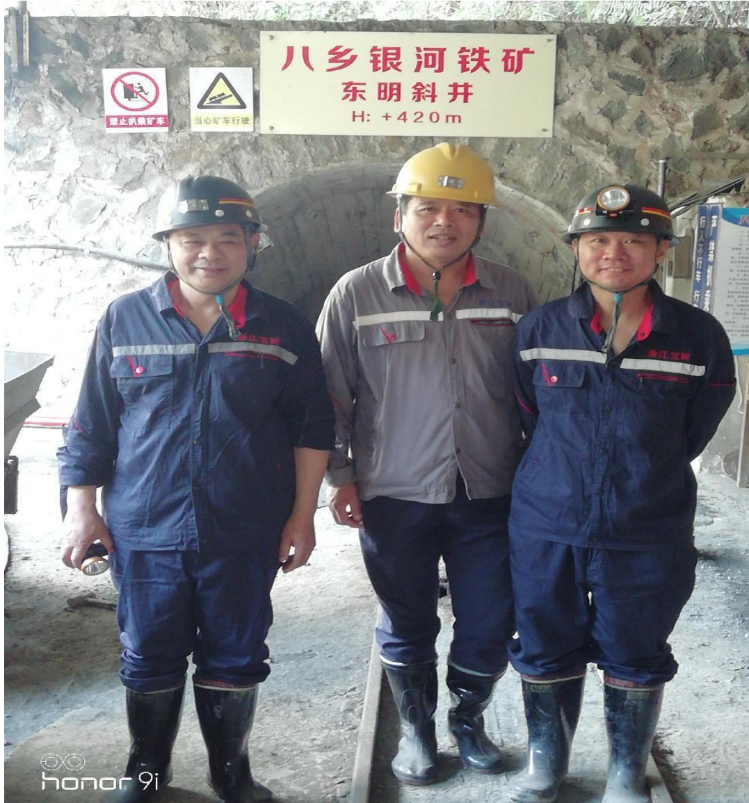
评价现场勘察图片