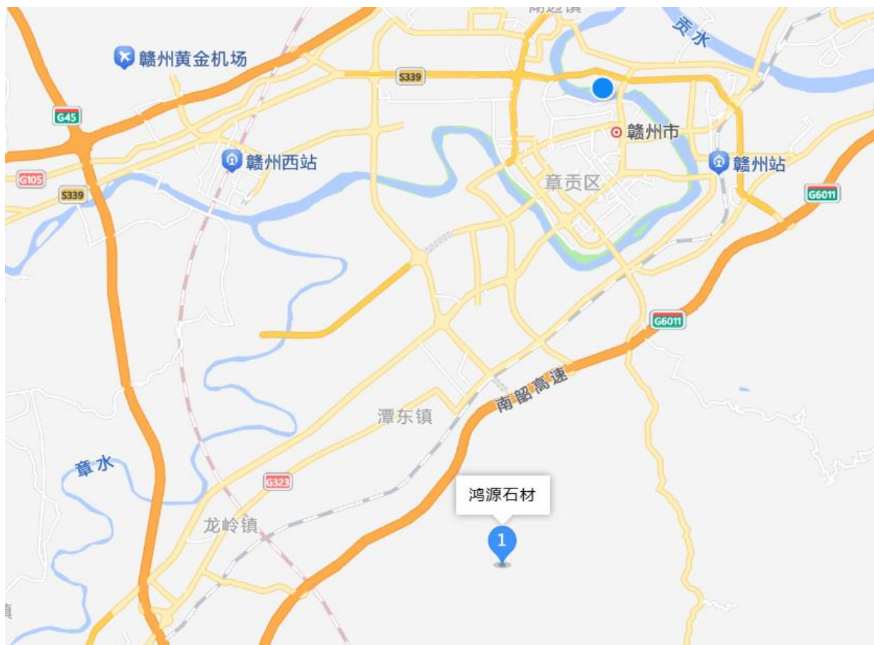
图 2-1 交通位置图

323 国道、京九铁路线和南韶高速 G6011 分别从矿区外西北侧通过，直线距离约 5.7km、4.1km 和 3.1km，从潭东镇至矿区有乡村水泥公路相通，交通地理位置见图 2-1。